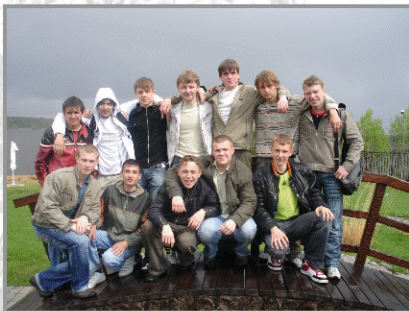
ухоженность, обилие цветочных клумб. Сразу после выхода из автобуса наш